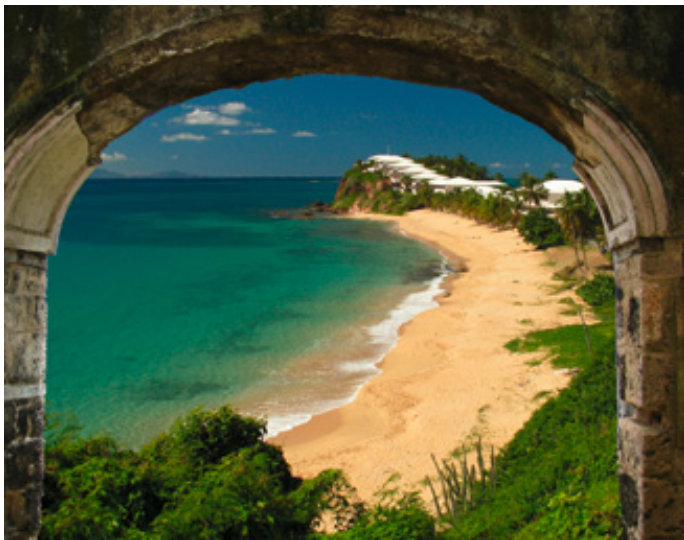
Portale öffnen den Ausblick

Enterprise Portale stellen eine Vielzahl mächtiger Funktionen zur Verfügung, migrieren Daten aus Fremdanwendungen, binden sie ins Portal ein und nutzen sie für die Prozessgestaltung.